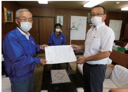
▲ 議長への要望活動 (8/5)