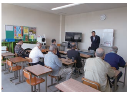
▲ 交通安全教室 (10/2)