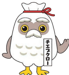
シルバー人材センター マスコットキャラクター