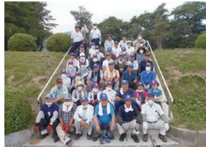
▲ 東・南部班ボランティア (8/30)