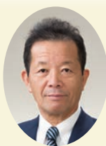
上市市長 横戸 長兵衛