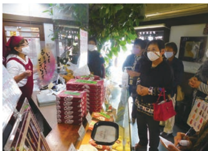
▲ 女性部商店街研修会 (10/22)