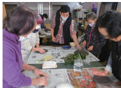
▲ 女性部陶芸教室 (12/6)