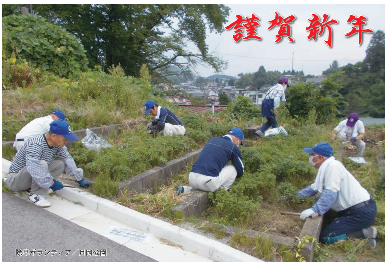
除草ボランティア/月岡公園