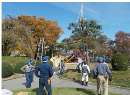
▲ 雪囲い研修会 (10/27)