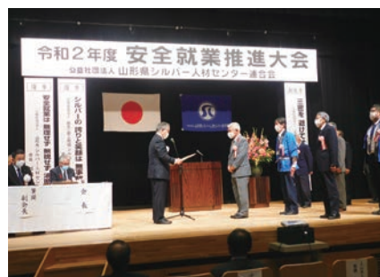
▲ 県安全就業推進大会 (10/16)