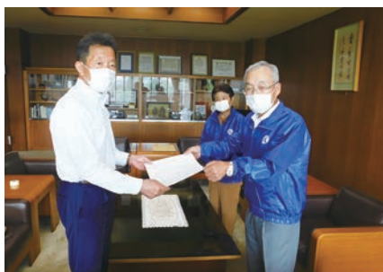
▲ 市長への要望活動 (8/5)